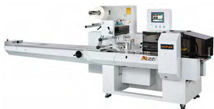
Página 19 EQUIPOS FLOWPACK