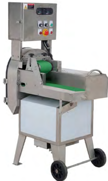
CORTADORA DE HOJAS Y VERDURAS JFC.305