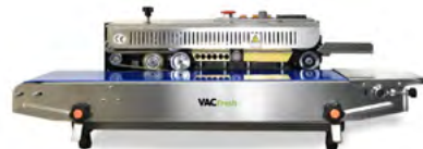
Páginas 11 - 13 SELLADORAS CONTINUAS