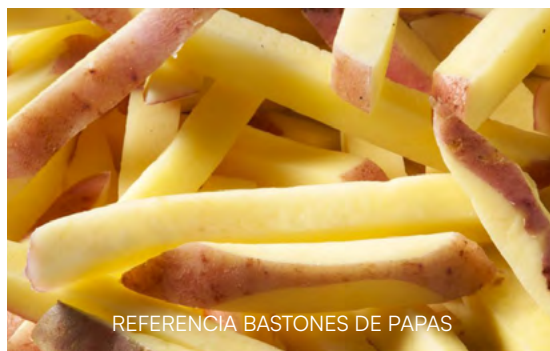
REFERENCIA BASTONES DE PAPAS