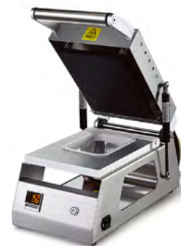
Página 18 SELLADORAS DE BANDEJAS