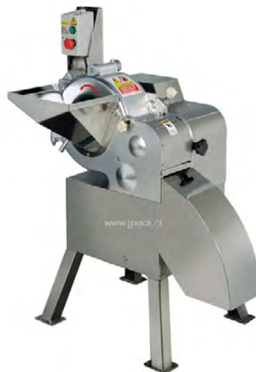
CORTADORA DE CUBOS Y BASTONES JCD.800