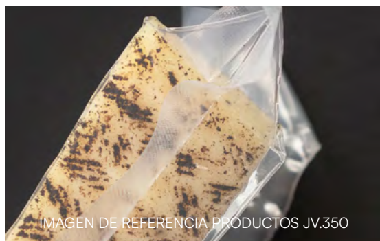
IMAGEN DE REFERENCIA PRODUCTOS JV.350