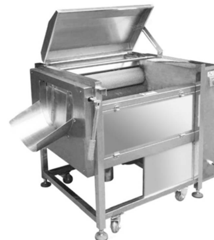
PELADORA Y LAVADORA TUBÉRCULOS JPP.400