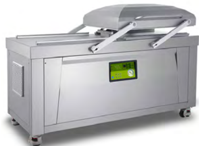
Páginas 06 - 10 ENVASADORAS VACÍO