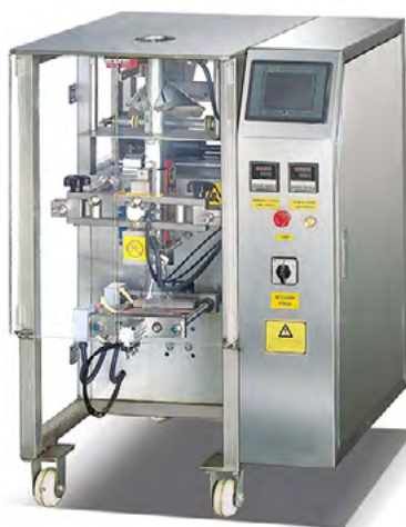
ENVASADORA VERTICAL J.320