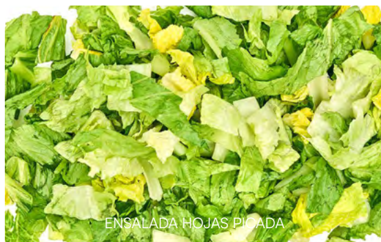
ENSALADA HOJAS PICADA