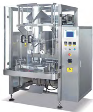
Página 20 ENVASADORAS VERTICALES