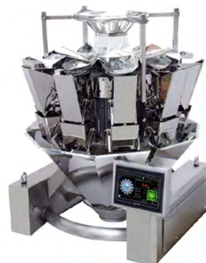
Páginas 14 -17 DOSIFICADORES