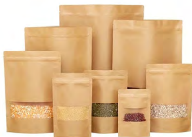
DOYPACK KRAFT VENTANA VARIEDAD DE TAMAÑOS