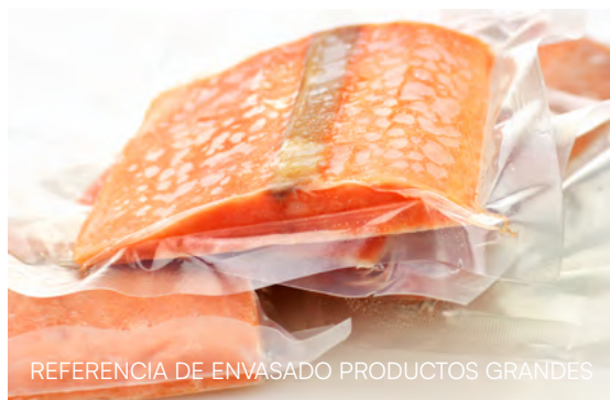
REFERENCIA DE ENVASADO PRODUCTOS GRANDES