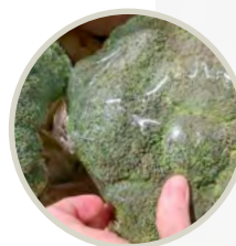
SELLADORA EN L EQUIPO SEMI AUTOMÁTICO