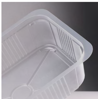
BANDEJAS TRANSPARENTE PP VARIEDAS DE TAMAÑOS