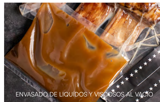
ENVASADO DE LIQUÍDOS Y VISCOSOS AL VACÍO