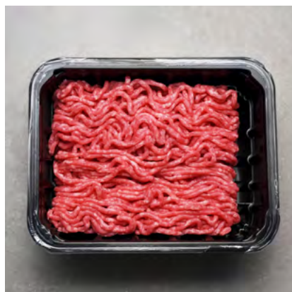
BANDEJAS NEGRAS PP VARIEDAS DE TAMAÑOS