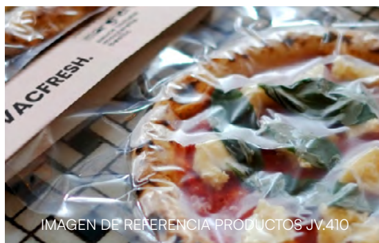
IMAGEN DE REFERENCIA PRODUCTOS JV.410