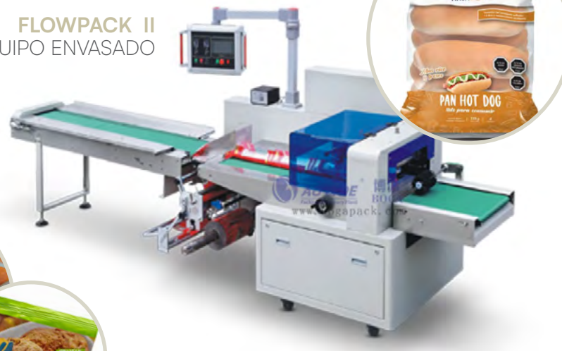
FLOWPACK II EQUIPO ENVASADO