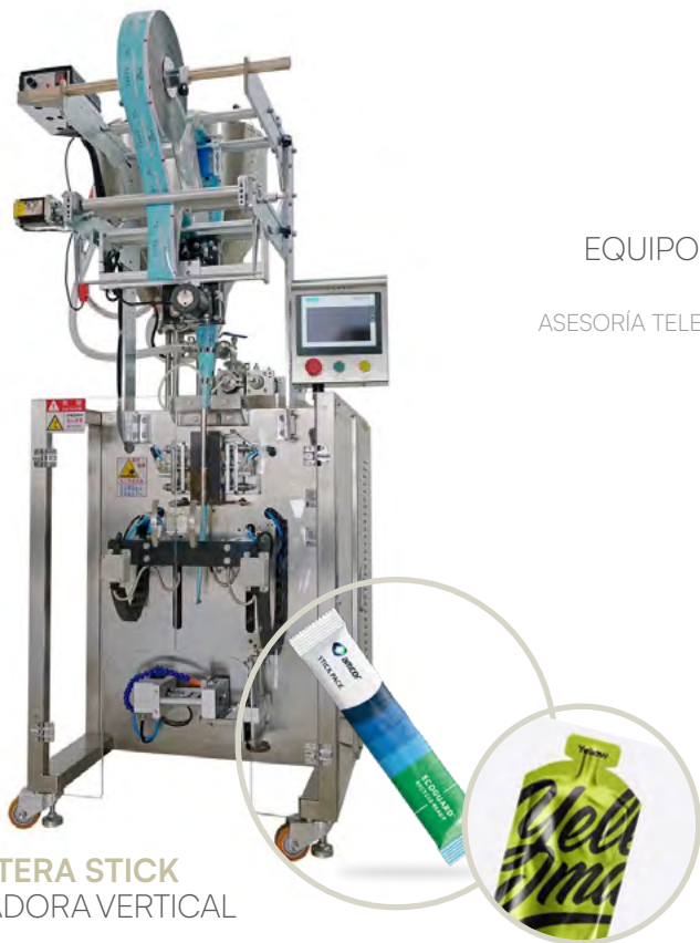
SACHETERA STICK ENVASADORA VERTICAL