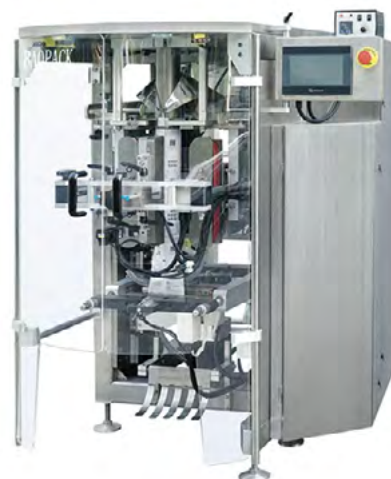
ENVASADORA VERTICAL JN.600*