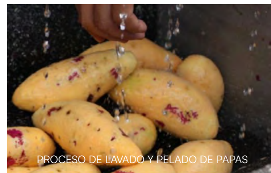
PROCESO DE LAVADO Y PELADO DE PAPAS