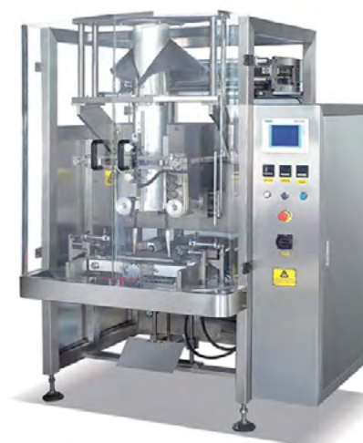
ENVASADORA VERTICAL J.620