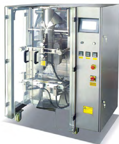
ENVASADORA VERTICAL J.520