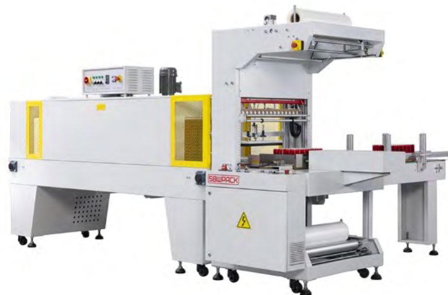
SELLADORA FRONTAL TUNEL TERMOCONTRACCIÓN PARA PACKS EQUIPO AUTOMÁTICO