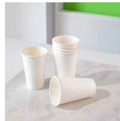
VASOS POLIPAPEL VARIEDAS DE TAMAÑOS Y DISEÑOS PERSONALIZADOS