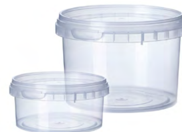
Página 23 - 25 INSUMOS DE EMPAQUE