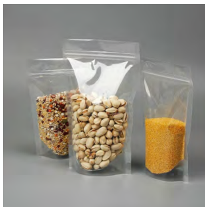
DOYPACK TRANSPARENTE VARIEDAD DE TAMAÑOS