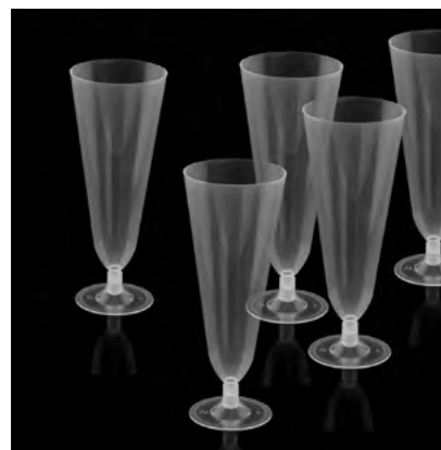
COPA GARZA TRANSPARENTE PP