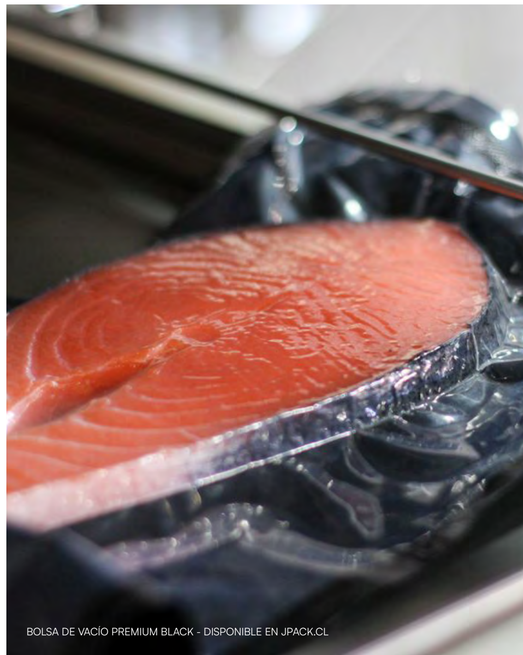
BOLSA DE VACÍO PREMIUM BLACK - DISPONIBLE EN JPACK.CL

Te invitamos a conocer todos nuestros equipos disponibles, también puedes encontrar más información en www.jpack.cl